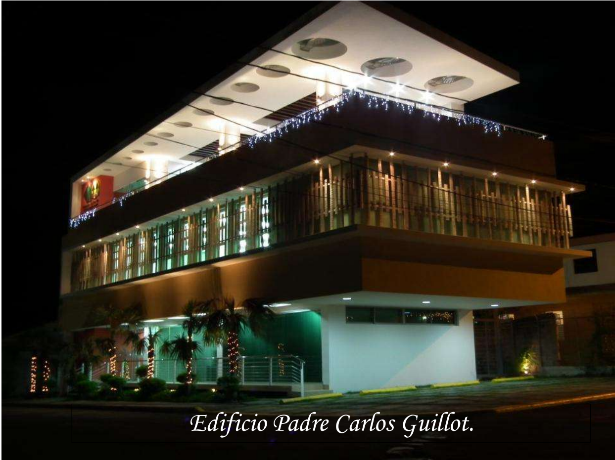
Edificio Padre Carlos Guillot.