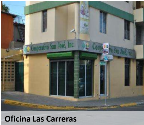
Oficina Las Carreras