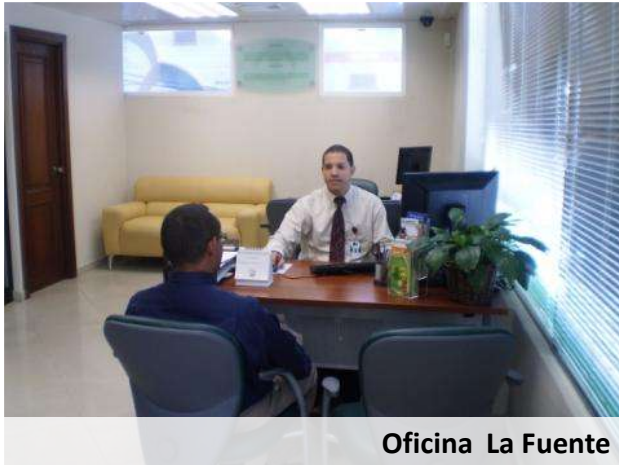
Oficina La Fuente