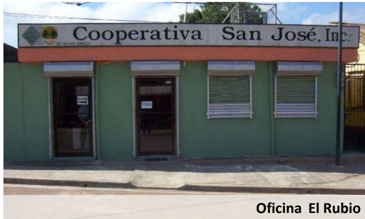
Oficina El Rubio