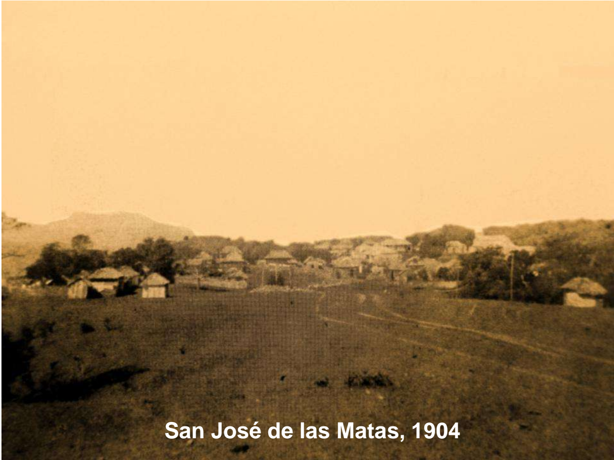
San José de las Matas, 1904