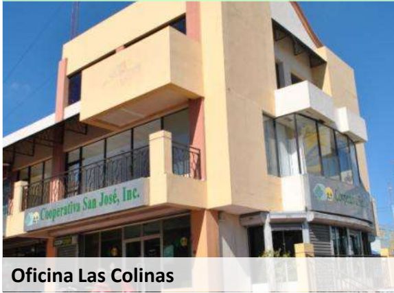
Oficina Las Colinas