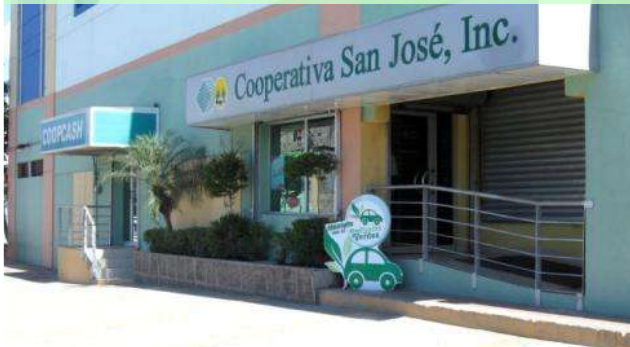
Oficina Los Reyes