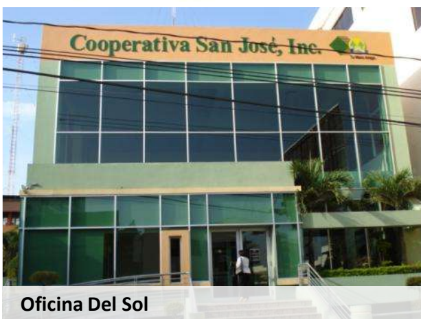
Oficina Del Sol