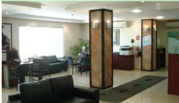
Oficina Santo Domingo