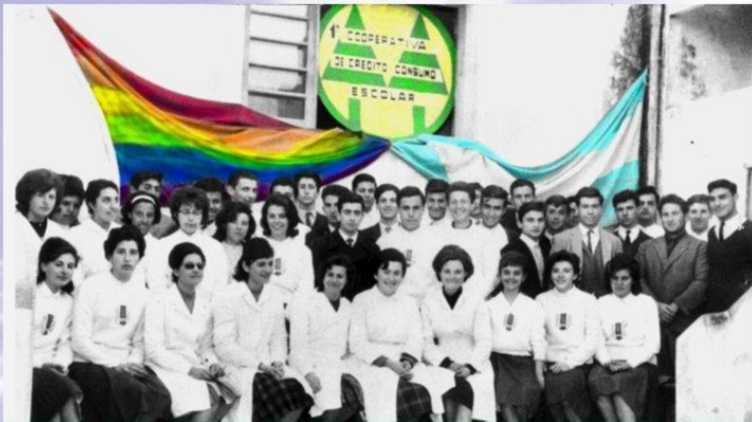
ESCUELA SUPERIOR DE COMERCIO JOAQUÍN V. GONZÁLEZ LA FALDA - CORDOBA - ARGENTINA PROMOCIÓN 1962