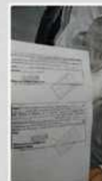
Entrega del Registro a la Cooperativa Escolar "Dejando Huellas" Colonia Fátima - Esc. Pr. N° 31