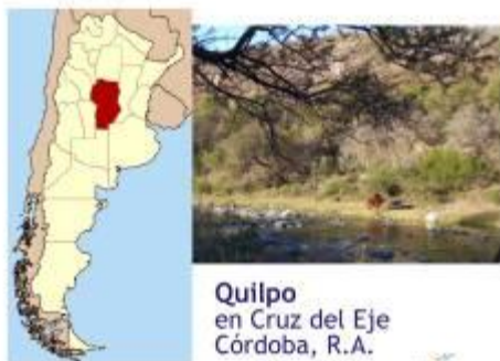
Quilpo en Cruz del Eje Córdoba, R.A.